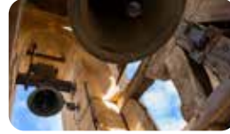
CAMPANAR DE L'ESGLÉSIA PRIORAL DE SANT PERE. Pl. Sant Pere, s/n