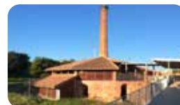
LA BÒBILA SUGRANYES Crta. Tarragona, 6V