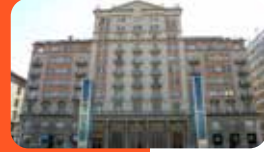
MUSEU DE REUS. LA LLIBERTAT. Plaça Llibertat, 13