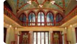
PAVEL·LÓ SISÈ DE L'INSTITUT PERE MATA Ctra. de l'Institut Pere Mata, s/n