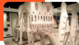
GAUDÍ CENTRE REUS Mercadal, 3

Reus és ple de cultura: endinsa't en una proposta diversa que combina història, art i experiències per a tots els públics. Descobreix la seva identitat a través d'espais singulars i viu la ciutat des de dins.