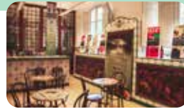
ESTACIÓ ENOLÒGICA. "CASA DEL VI I DEL VERMUT" Passeig Prim, 4-6

Reus és ple de cultura: endinsa't en una proposta diversa que combina història, art i experiències per a tots els públics. Descobreix la seva identitat a través d'espais singulars i viu la ciutat des de dins.