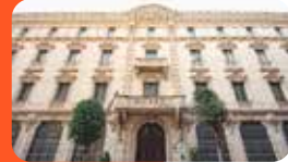
MUSEU DE REUS. EL RAVAL. Raval Santa Anna, 59