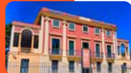
MUSEU DE REUS. EL CENTRE DE LA IMATGE MAS IGLESIAS Pl. de Ramon Amigó, 1