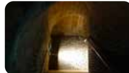
EL REFUGI ANTIAERI LA PATAcada Pl. de la Patacada, 12